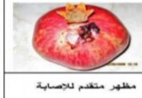
مظهر متقدم للإصابة